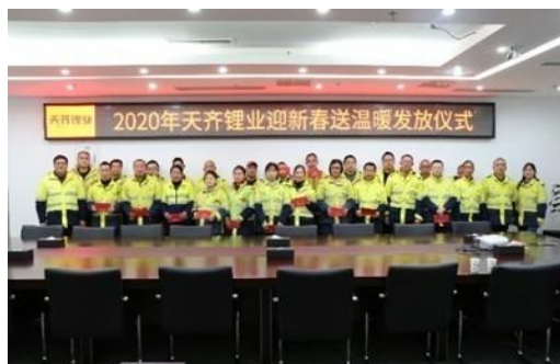
2020年春节天齐锂业员工慰问活动