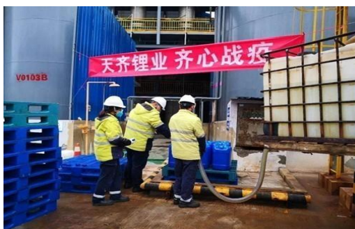
天齐锂业捐献次氯酸钠溶液

2020年初，面对新型冠状病毒肺炎疫情，我们及时响应，各司其职，在安全复工的基础上积极捐款捐物，向社会献出天齐锂业的一份力。此外，我们心系海外同胞，得知智利疫情严重，公司工会积极配合行政部紧急搜索渠道，采购20万只口罩运往智利，共抗击疫情，彰显企业的国际责任。