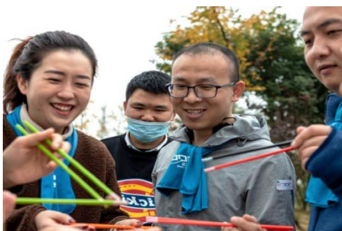
公筷益走迎大运活动

我们不仅致力于将志愿服务精神根植于天齐品牌，同时也与其他公益组织积极合作，推动海内外志愿文化交流。报告期内，我们参与了双十一·公筷益走迎大运活动，倡导使用公筷。共计36名天齐志愿者参与活动布展、引导和主持，累计贡献服务小时数129.5小时，活动参与总人数超600人。此外，通过西澳博物馆的天齐连接展厅，我们持续推进中澳友好文化建设，为国际文化交流做贡献。