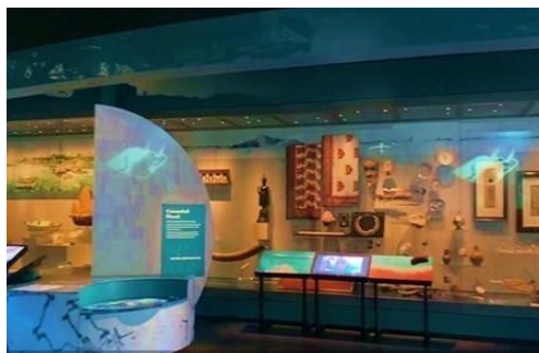
西澳博物馆——天齐连接展厅